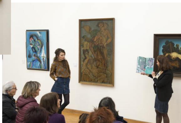
Fanny Ducassé, Parcours en correspondance (2018)